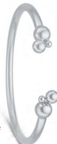
Armrings 245602 m/svingbar lås 1.875,-