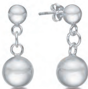
Øreringe 242213 685,-