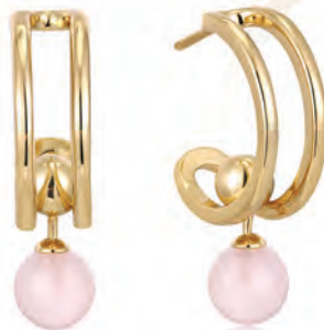
SPACED OUT Hoops Forgyldt sølv og rosa kvarts 1.150,-