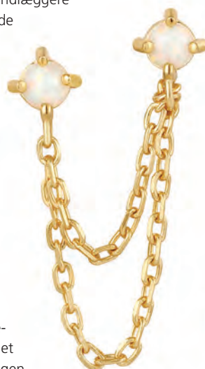
EAR EDIT Enkelt øring Forgylt sølv og opaler 450,- pr stk