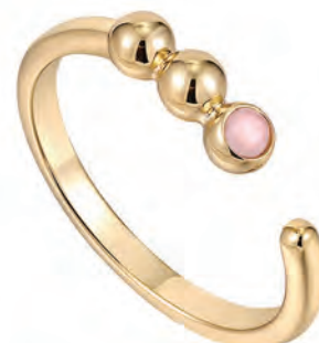
SPACED OUT Justerbar ring Forgylt sølv Rosa kvarts 595,-