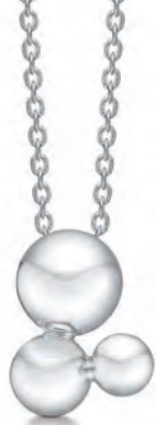
Vedhæng 242710K 45 cm 1.275,-