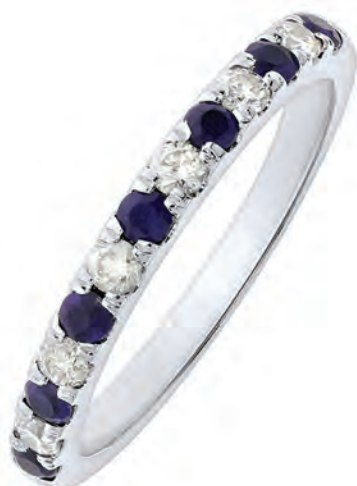
RING 14 kt hvidguld 7 safirer og 6 brillanter Brillanter i alt 0,23 ct w/si Pris 15.500,-