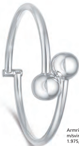
Armrings 164319 m/svingbar lås 1.975,-