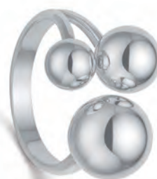
Ring 240908 1.450,-