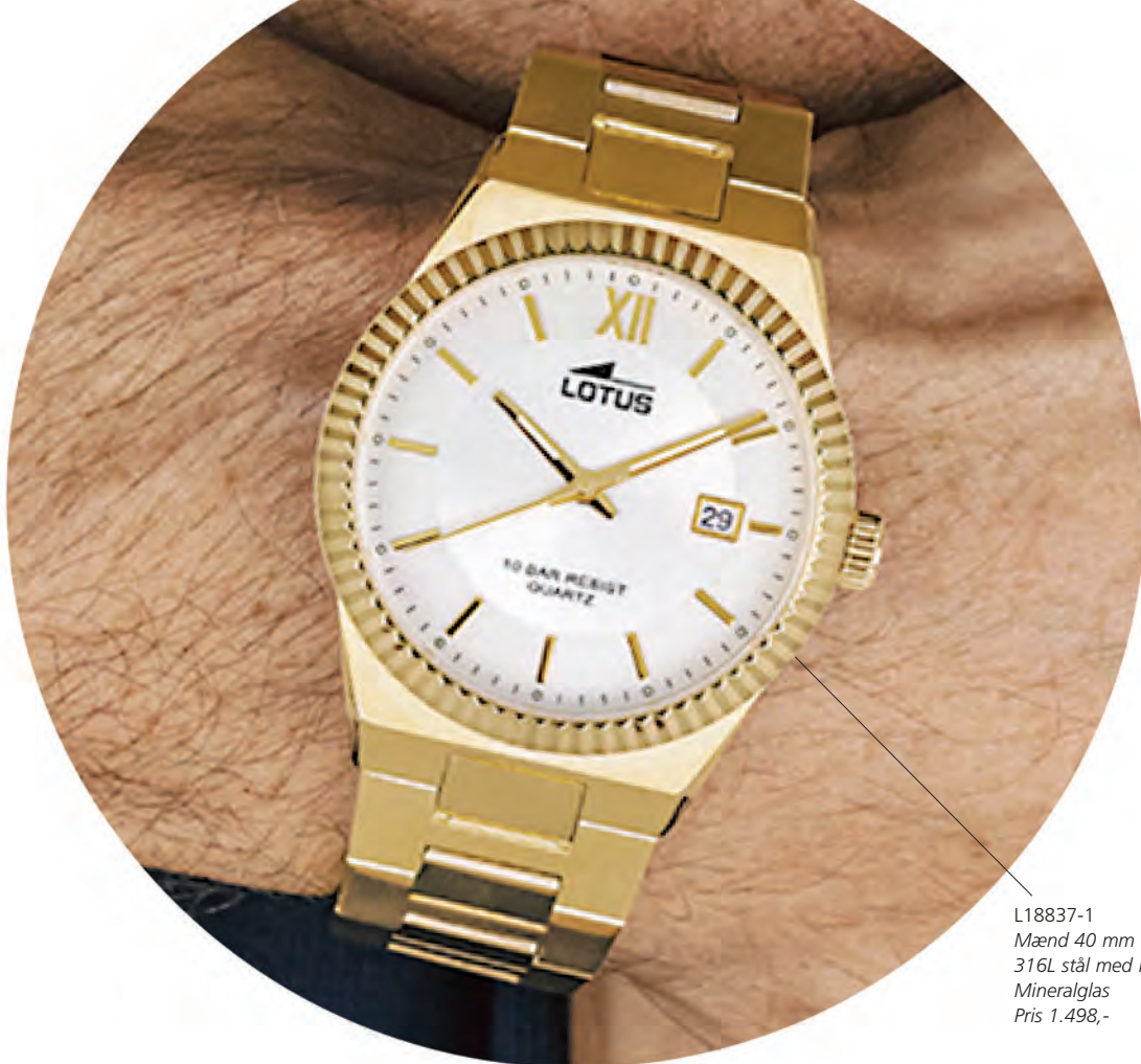
L18837-1 Mænd 40 mm 316L stål med IP guld Mineralglas Pris 1.498,-