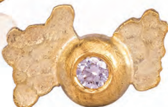
CHAMPOO Ørestik nr 3 14 kt guld Diamant 3.375,-