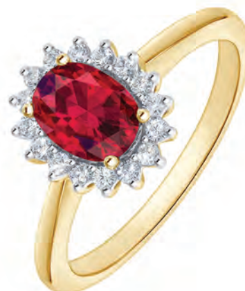
RING 14 kt guld Oval rubin Brillanter I alt 0,25 ct w/si Pris 17.800,-