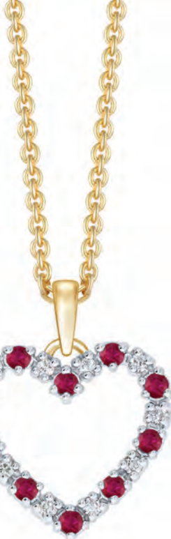
HALSKÆDE 14 kt guldvedhæng 10 rubiner og 10 brillanter Brillanter i alt 0,14 ct w/si Forgylt sølvkæde 42-25 cm Pris 9.000,-