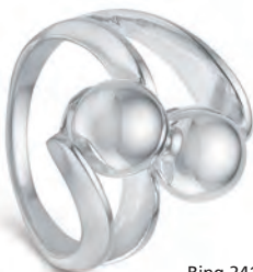
Ring 241008 1.175,-