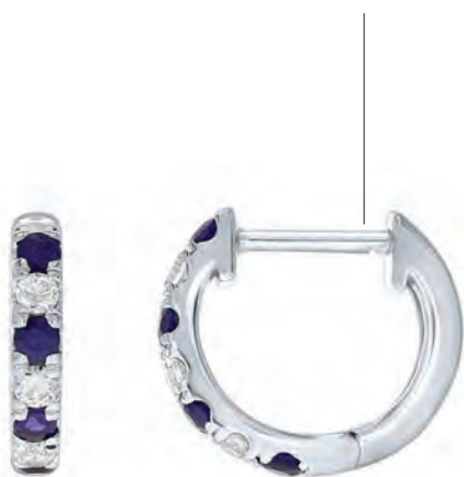
KREOLER 14 kt hvidguld 8 safirer og 6 brillanter Brillanter i alt 0,24 ct w/si Pris 14.800,-