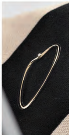
AMORF OVAL Guldbroche med diamant i Ærtekrone serien.