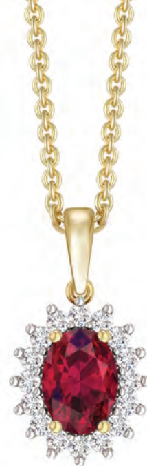
HALSKÆDE 14 kt guld Oval rubin Brillanter I alt 0,25 ct w/si Forgylt sølvkæde Pris 14.500,-

Hvad er det, der får brillanter til virkeligt at funkle? Når de sættes tæt sammen med rubiner, smaragder, topaser og safirer, naturligvis!