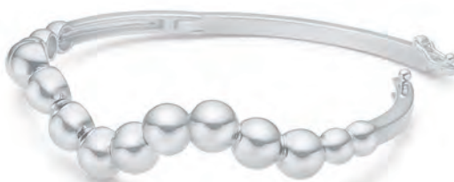
Armrings m/lås 165319 2.475,-