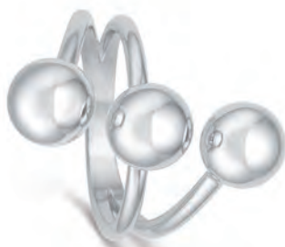
Ring 242708 1.175,-