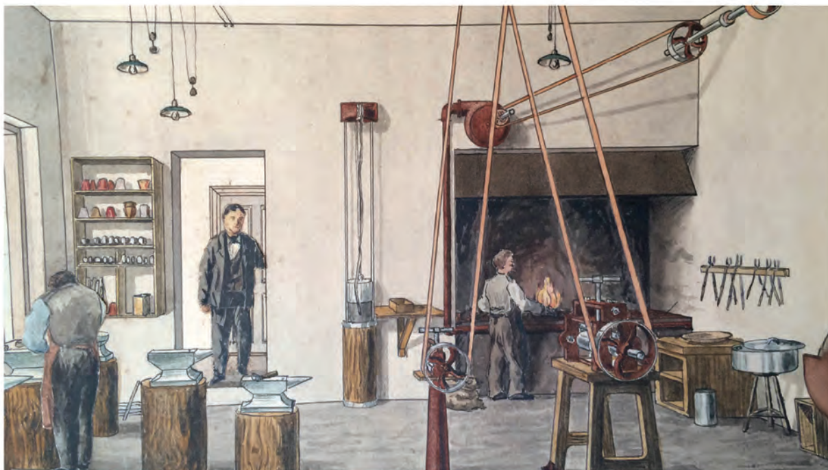
Skitsetegning fra 1905 af produktion og valserum i fabrikken på Hobrovej, hvor tydeligt ses remmene fra dynamoerne, der driver de forskellige maskiner.

Guldvedhæng med 0,05 ct brillant 14 kt 9.800,- 8 kt 6.900,-