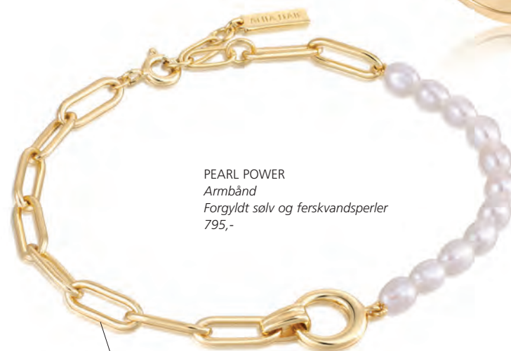
PEARL POWER Armbånd Forgylt sølv og ferskvandsperler 795,-

Ear Edit – eller på dansk: Redigér dit øre! Det gøres nemt med de mange forskellige designs i serien, blandt andet med cubic zirkonia og Kyoto opaler.