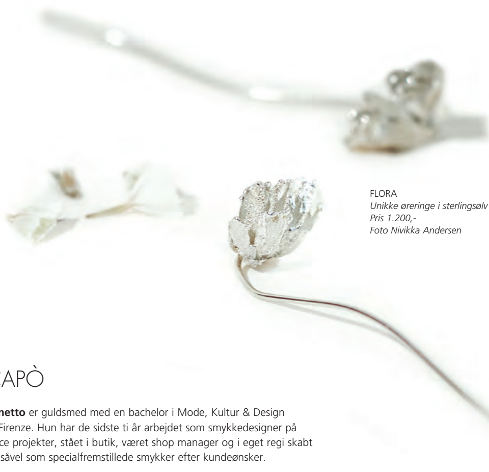
FLORA Unikke øringer i sterlingsølv Pris 1.200,-