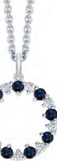
HALSKÆDE 14 kt hvidguldsvedhæng 9 safirer og 9 brillanter Brillanter i alt 0,14 ct w/si Rhodineret sølvkæde 42-45 cm Pris 8.500,-

– Vi vil på ingen måde svigte de faste kunder. De fleste af dem har været med hele vejen, i alle 31 år. Det er helt fantastisk, og det er jo et tæt samarbejde, vi har med dem, beretter Torben.