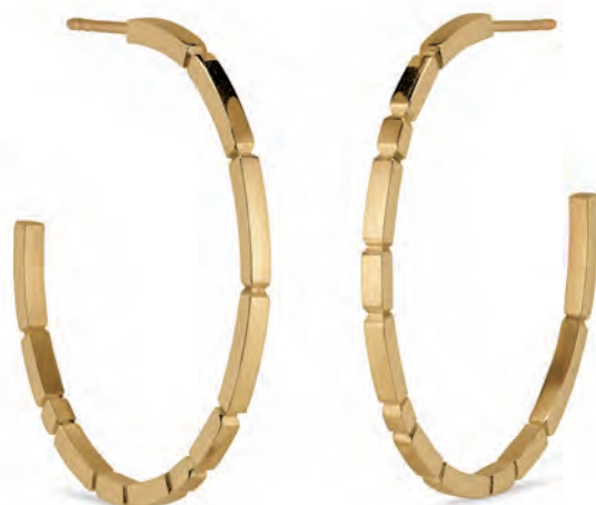
DEADWOOD SQUARE Øreringe, store 14 kt guld 5.400,-