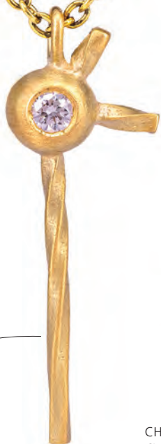
CHAMPOO Vedhæng nr 1 14 kt guld Diamant 3.050,-