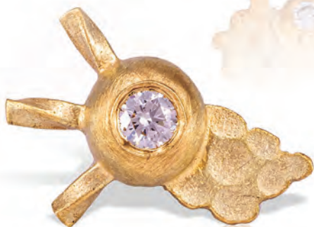
CHAMPOO Ørestik nr 1 14 kt guld Diamant 4.125,-