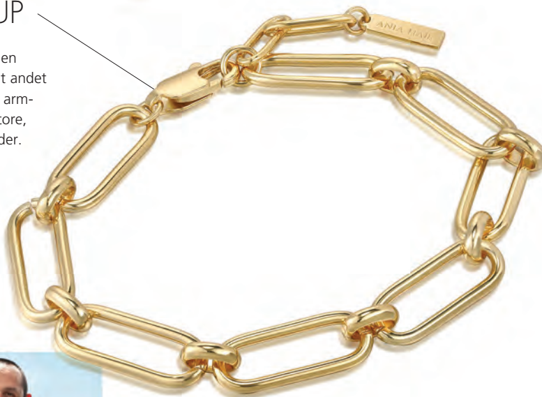
LINK UP Armbånd Forgyldt sølv 995,-

Link Up serien består blandt andet af markante armbånd med store, kantede kæder.