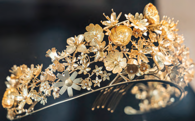
Naasut diademet, som H.M. Dronningen modtog i gave fra det grønlandske folk i anledning af 40-års regentjubilæet i 2012. Diademet er skabt i grønlandsk guld og brillanter af guldsmed Nicolai Appel og viser 17 grønlandske blomster. Naasut betyder blomster på grønlandsk.

fokus på noget smukt og værdifuldt som Grønlands guld og rubiner samt på relationen mellem os, når den er gensidig og respektfuld. En relation, som vores kloge dronning altid er fortaler for. Det kan opleves på udstillingen, blandt andet i Naasut-diademet, som dronningen modtog i gave fra det grønlandske folk i anledning af 40 års regentjubilæet i 2012. Diademet er skabt i grønlandsk guld og brillanter af guldsmed Nicolai Appel og viser 17 grønlandske blomster.