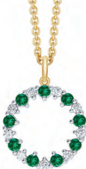
HALSKÆDE 14 kt guldvedhæng 9 smaragder og 9 brillanter Brillanter i alt 0,14 ct w/si Forgylt sølvkæde 42-25 cm Pris 8.300,-