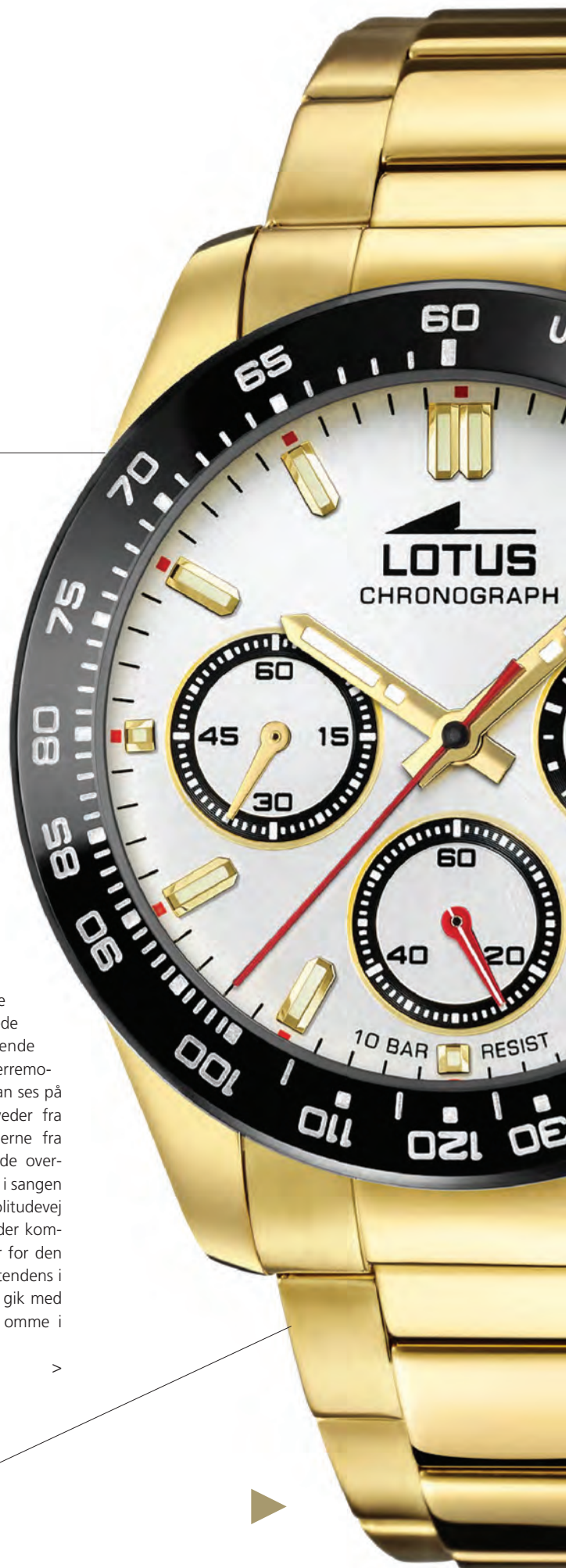
L18886-2 Damer 31,5 mm 316L stål Mineralglas Pris 1.498,-

Hvis du kaster et blik tilbage på tidligere tiders modeluner, er jeg sikker på, du vil være enig med mig i, at meget af det, der har været moderne gennem tiderne, også har været grimt, upraktisk og meget lidt flatterende for den menneskelige krop. Tænk blot på de fremhævede bækkenpartier og stramtsiddende strømpeben, der var ypperste herremode på Solkongens tid, og som kan ses på stolte malerier af kronede hoveder fra dengang. Eller på tournurekjolerne fra slutningen af 1800-tallet med de overdrevne bagperroner, der ligesom i sangen om regnvej om mandagen på Solitudevej leder tanken hen på en skude, der kommer glidende for fulde sejl. Eller for den sags skyld den ganske uheldige tendens i 80'erne, hvor tyndhårede mænd gik med en lille stump af en hestehale omme i nakken.