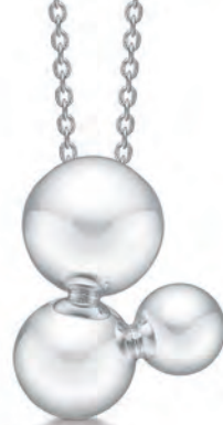
Vedhæng 240910K 45 cm 1.450,-