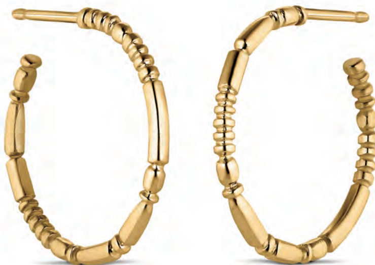
DEADWOOD Øreringe 14 kt guld 3.600,-

SOM GULDSMED SKAL MAN HAVE TÅLMODIGHED OG ELSKE AT NØRDE.