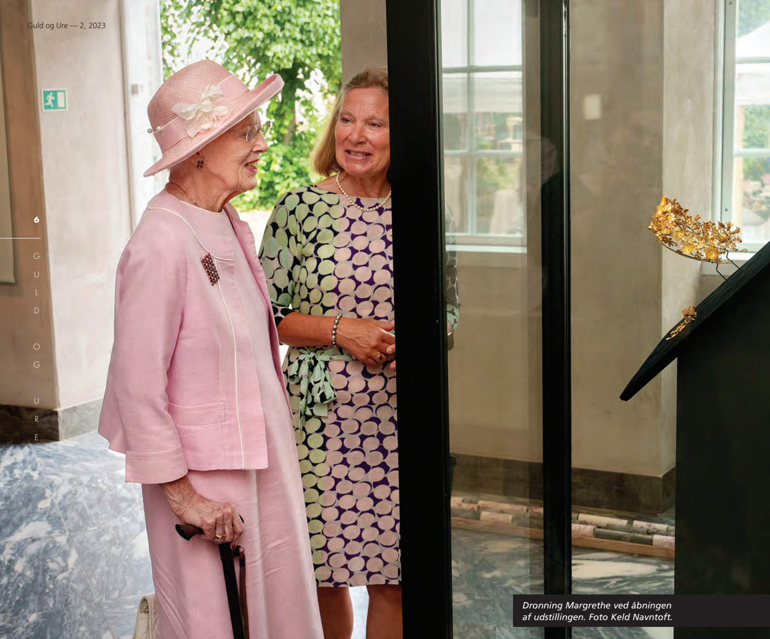
Dronning Margrethe ved åbningen af udstillingen.