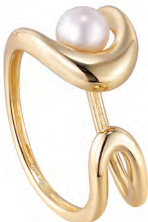
PEARL POWER Justerbar ring Forgyldt sølv Ferskvandsperle 795,-

Smykkerne er i sterlingsølv, forgyldt eller rhodineret, og således inden for det populære affordable segment. Ania Haie er miljøbevidste ved at genbruge pap i emballage og arbejde for at minimere spild og CO2-aftryk i produktionen. I Danmark importeres smykkerne af norske Optura Nordic. Her på siderne giver vi smagsprøver på seks aktuelle kollektioner. ■