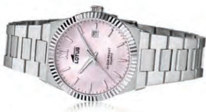
L18838-2 Damer 31,5 mm 316L stål Mineralglas Pris 998,-