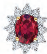
ØRESTIKKER 14 kt guld Ovale rubiner Brillanter I alt 0,30 ct w/si Pris 14.500,-

– Vi ønsker et noget bredere sortiment, men beholder naturligvis vores populære standardmotiver som kugler, kadaver-skilte, stjernetegn, kors, hjerter, bogstaver og tro-håb-og-kærlighed. Dem er vores faste kunder supertilfredse med, og nu har vi også disse smykker i forgylt sølv. >